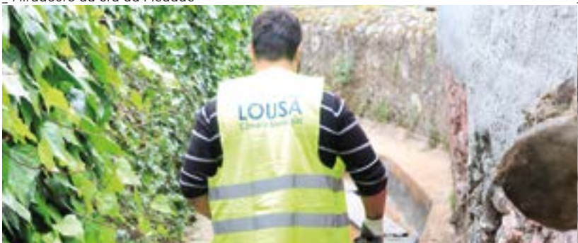
_ Regadio no Casal dos Rios