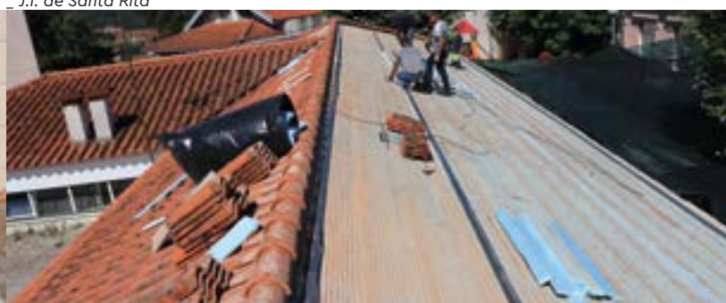
Jardim de Infância do Regueiro