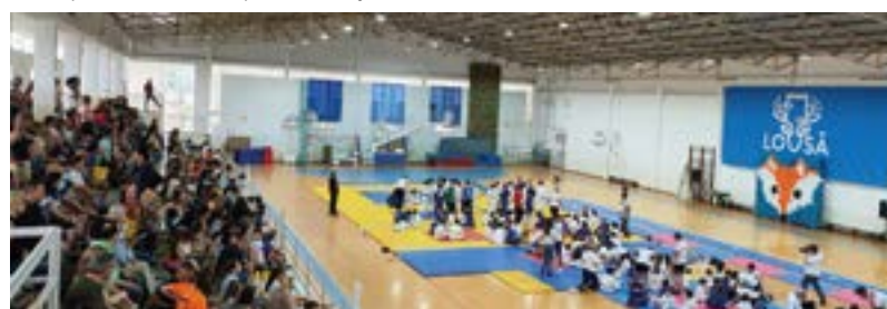
_ Judo – Torneio Raposinhos