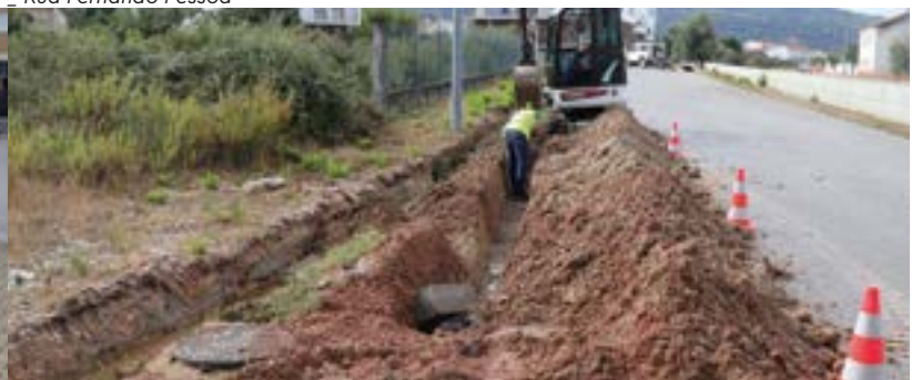
_ Rua Padre Daniel Montenegro