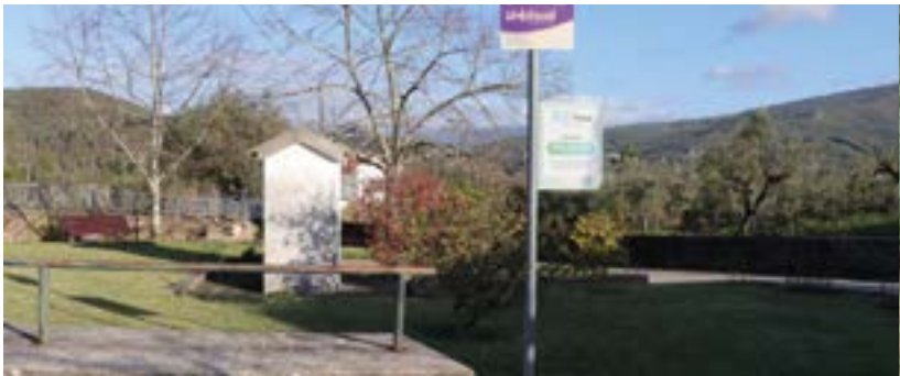
_ Lomba de Alveite – Paragem Transportes