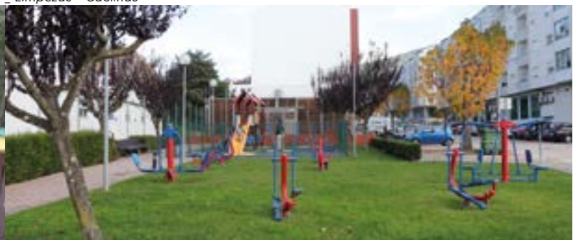
_ Parque Infantil Courelas