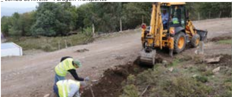
_ Limpeza Estrada das Hortas