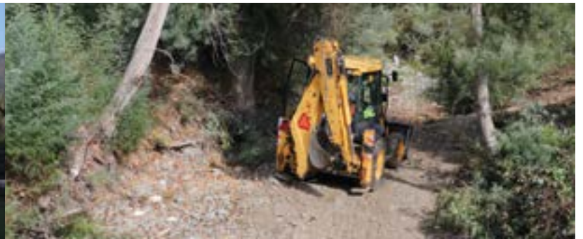
_ Limpezas Ribeira de São João