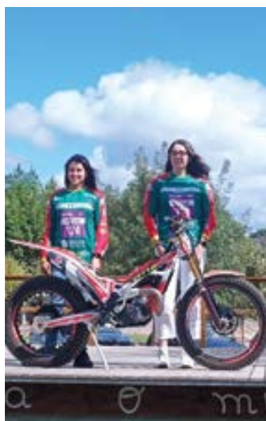
_ Campeonato do Mundo de Trial