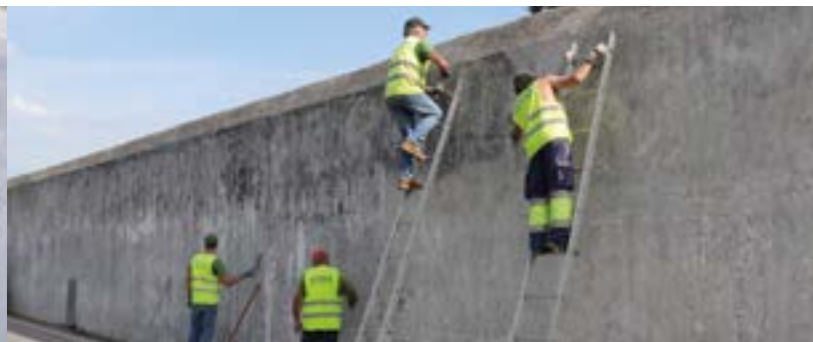
Cemitério da Lousã