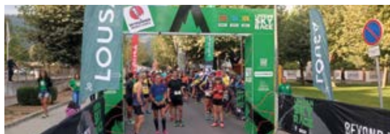
_ Lousã Skyrace