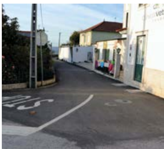
_ Rua do Canto