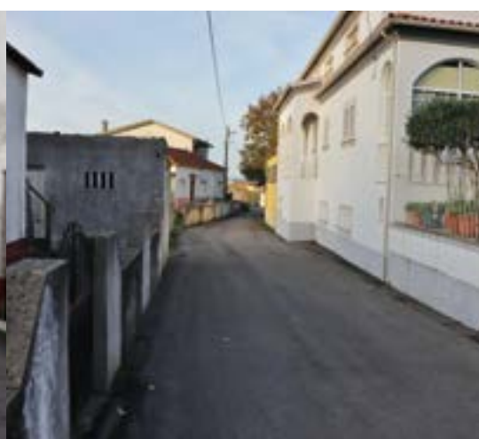
_ Fornea de Cá