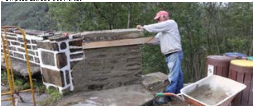
_ Miradouro da Sra da Piedade