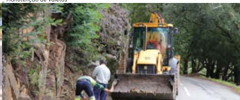
Manutenção de Valetas – Candal