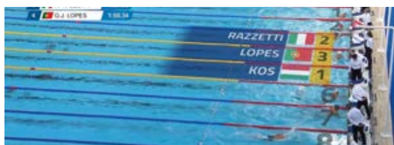
_ Campeonatos da Europa de Natação