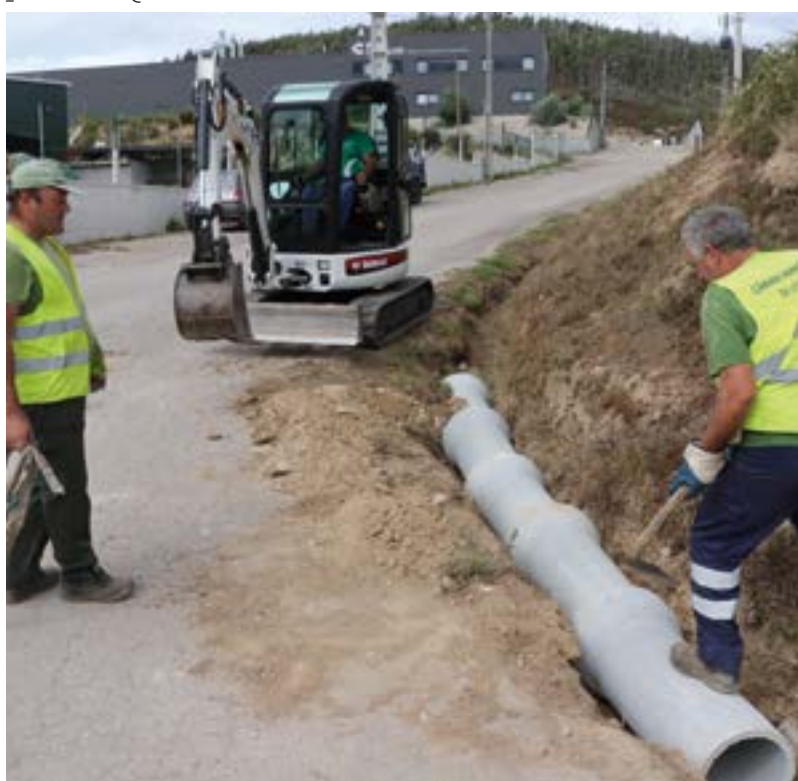
_ Vale da Ursa