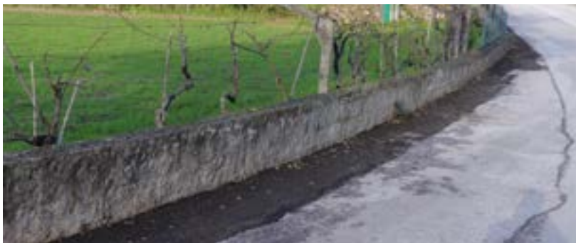
Estrada do Moínho Velho – Pavimentação de Bermas