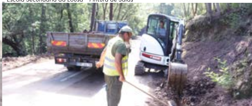
Manutenção de Valetas