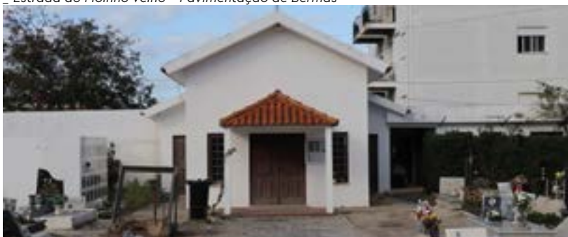
Cemitério da Lousã