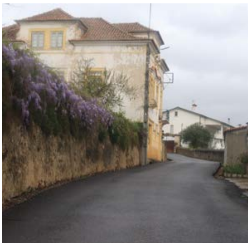
_ Rua da Escola