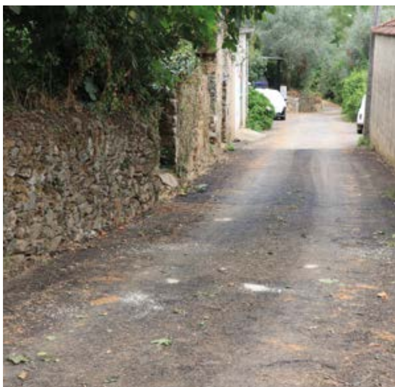
_ Estrada da Quinta

Apresentamos, abaixo alguns exemplos do trabalho realizado conjuntamente: