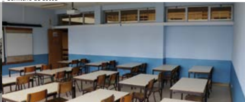
Escola Secundária da Lousã – Pintura de Salas