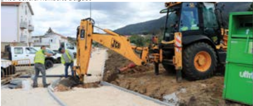
_ Rua Sanches da Gama – Mudança de boca de Incêndio