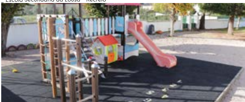
J.I. do Freixo – Parque Infantil