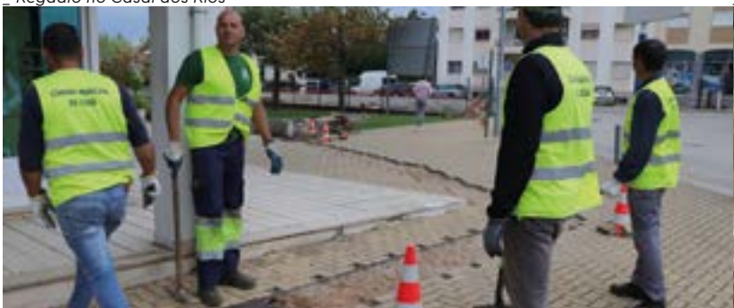
_ Rua General Humberto Delgado