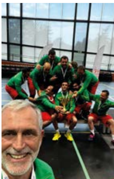
_ Basquetebol – Campeão da Europa Virtus Sports, European Summer Games