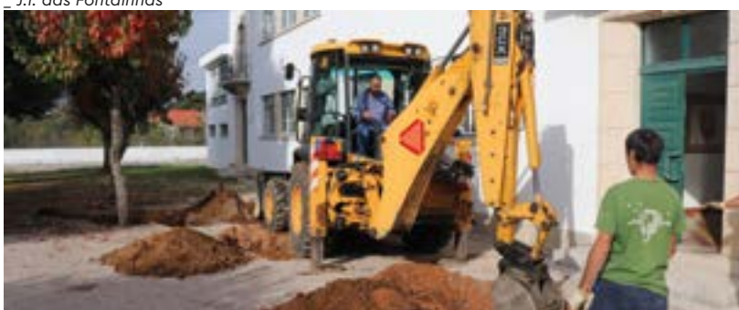
Jardim de Infância do Freixo