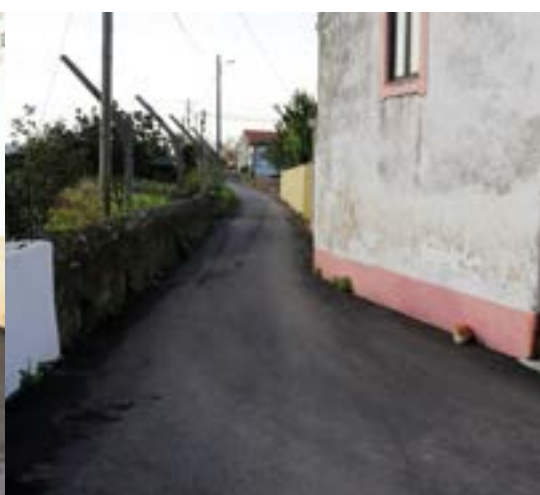
_ Ponte Quadíz