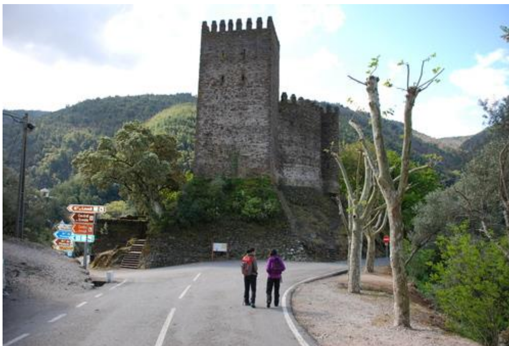
Fig. 1 – Castelo da Lousã

O circuito localizar-se-á ao longo da estrada que liga a Vila à Ermida da Sr a da Piedade, nos espaços contíguos que o permitam.