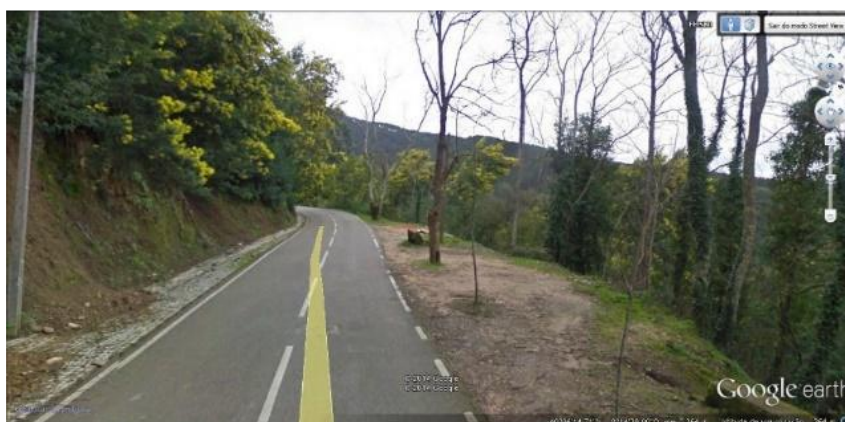
Fig. 3 – Localização Primeira Estação