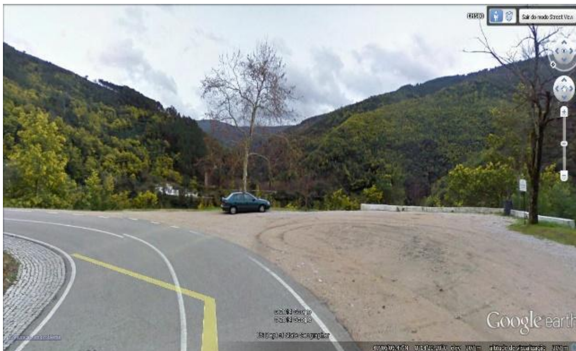
Fig. 4 – Localização Segunda Estação

O que pretendemos é construir um percurso, um circuito, ao longo do qual os interessados poderão encontrar duas estações com equipamentos estrategicamente dispostos para a prática de exercício físico devidamente identificados com placas informativas, das quais constarão para além da identificação do local, o propósito específico daquela estação específica bem como a enumeração dos equipamentos ali colocados e ainda algumas instruções básicas sobre o seu funcionamento e adequada utilização (regras de segurança).