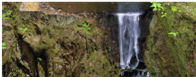
↑ Moinho de rodízio dos Paivas • Paiva's Watermill