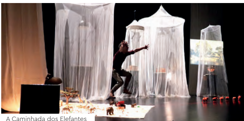
A Caminhada dos Elefantes