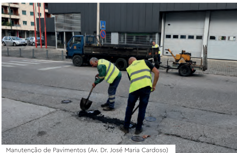
Manutenção de Pavimentos (Av. Dr. José Maria Cardoso)