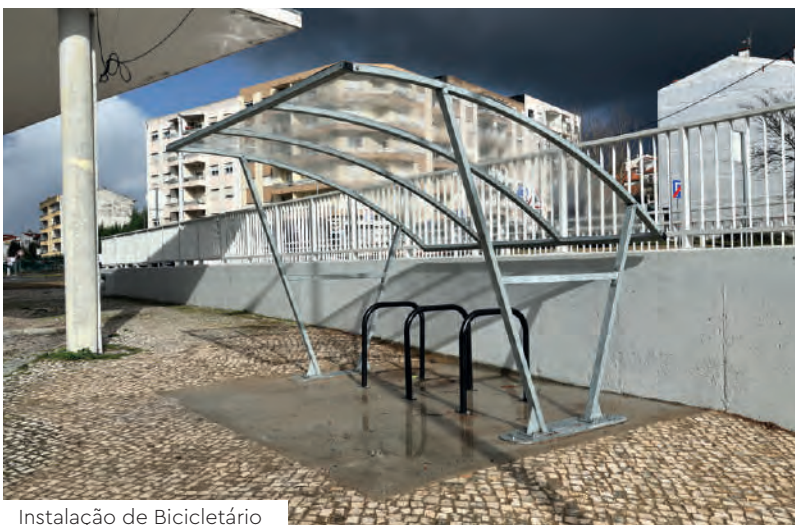
Instalação de Bicicletário