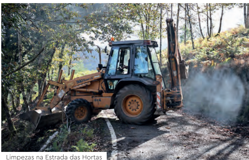
Limpezas na Estrada das Hortas