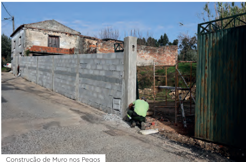
Construção de Muro nos Pegos