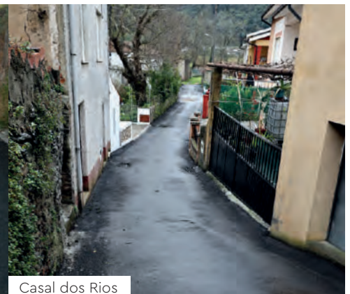
Casal dos Rios