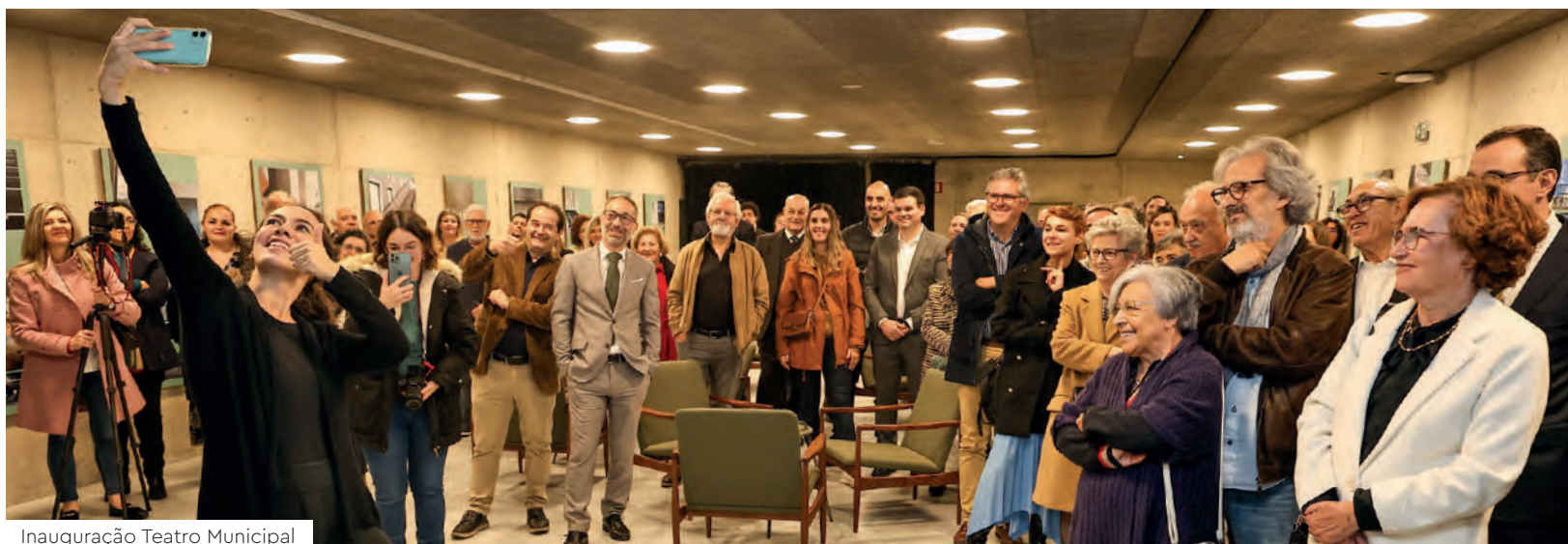
Inauguração Teatro Municipal

Este número elevado de participação nos espetáculos que têm sido promovidos, comprova que a estratégia de diversificação de públicos, mas acima de tudo a qualidade oferecida é a mais correta e tem reforçado o posicionamento da Lousã como referência cultural na Região e mesmo a nível nacional.