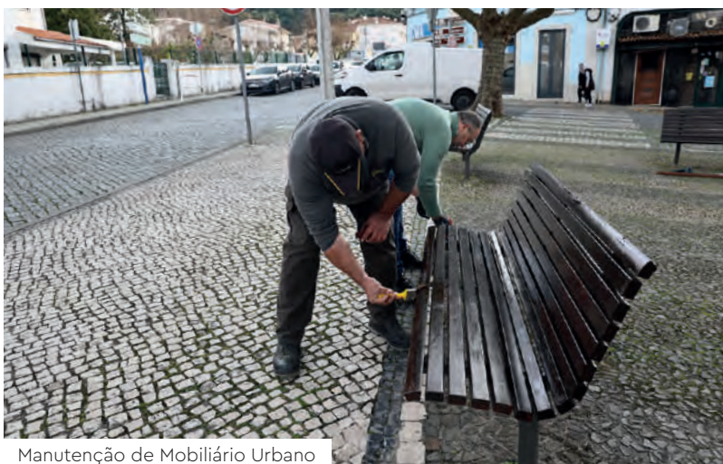
Manutenção de Mobiliário Urbano