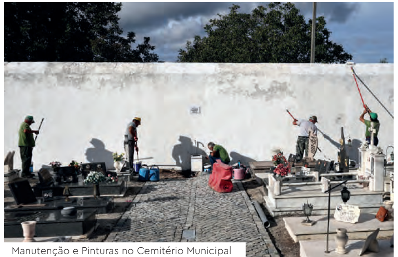
Manutenção e Pinturas no Cemitério Municipal