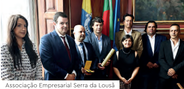
Associação Empresarial Serra da Lousã