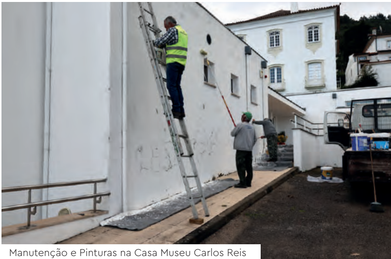
Manutenção e Pinturas na Casa Museu Carlos Reis