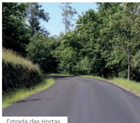
Estrada das Hortas