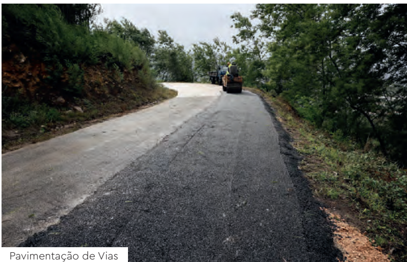
Pavimentação de Vias