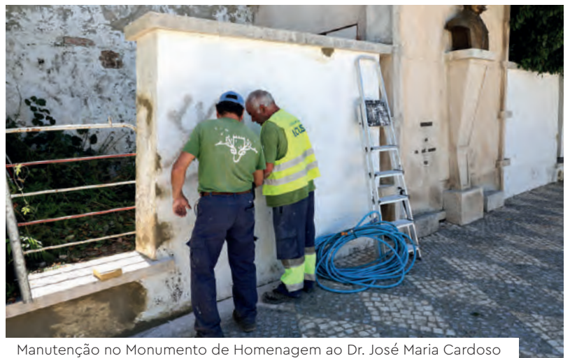
Manutenção no Monumento de Homenagem ao Dr. José Maria Cardoso