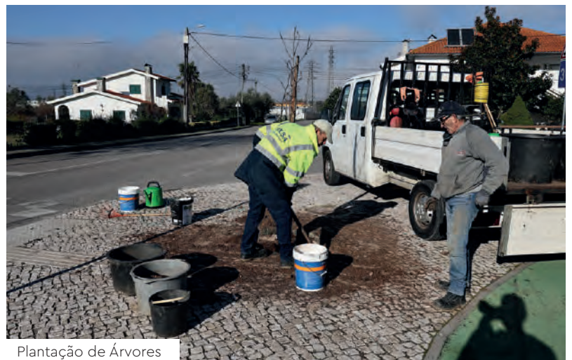
Plantação de Árvores