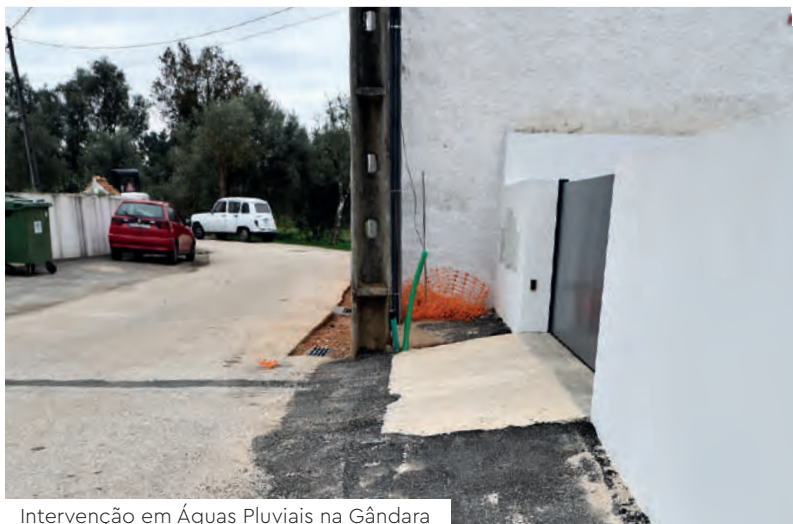
Intervenção em Águas Pluviais na Gândara