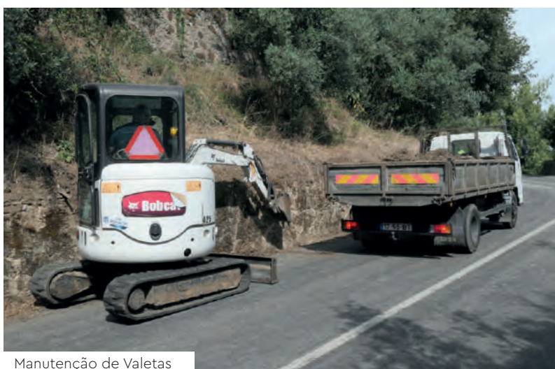
Manutenção de Valetas