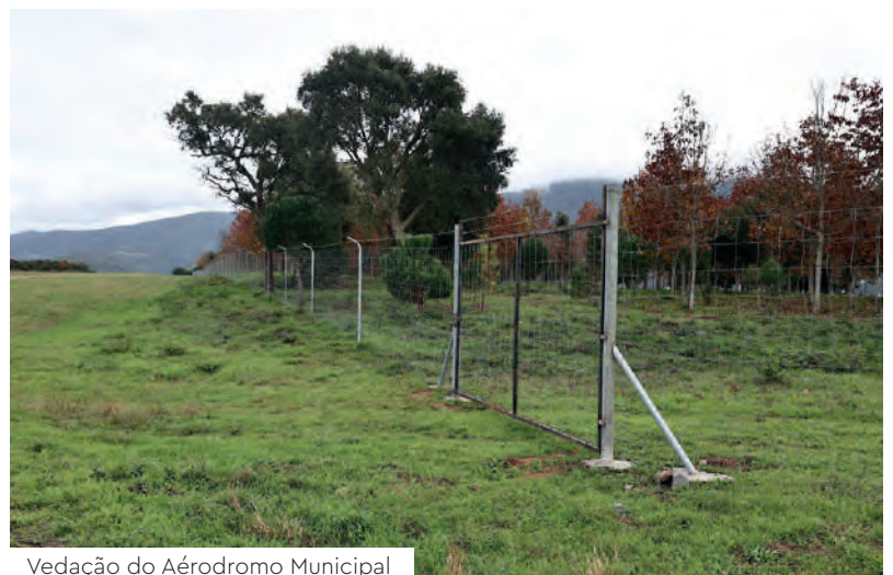
Vedação do Aérodromo Municipal