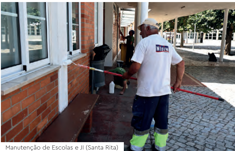
Manutenção de Escolas e JI (Santa Rita)