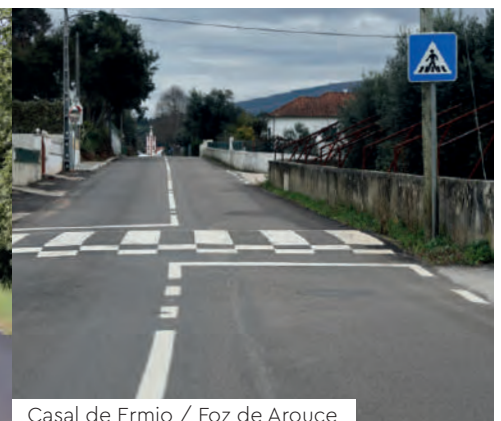
Casal de Ermio / Foz de Arouce