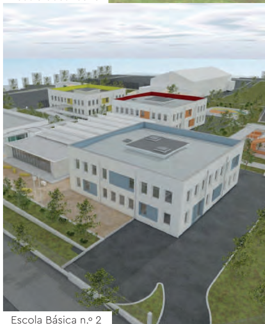
Escola Básica n.º 2