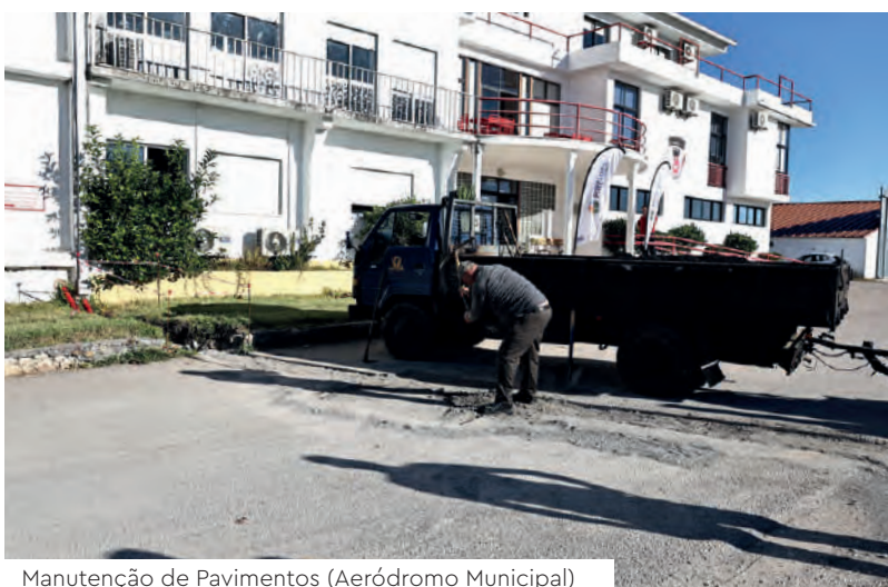
Manutenção de Pavimentos (Aeródromo Municipal)