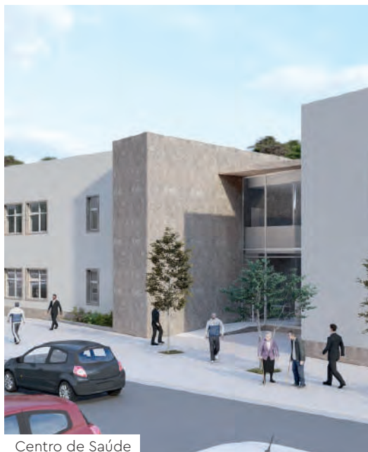
Centro de Saúde