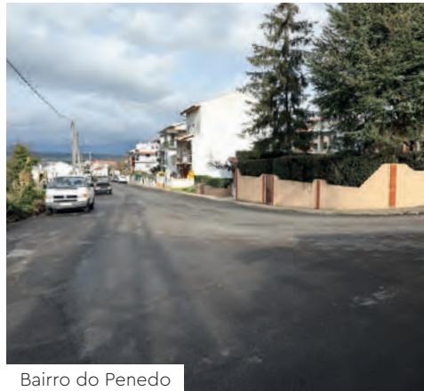
Bairro do Penedo