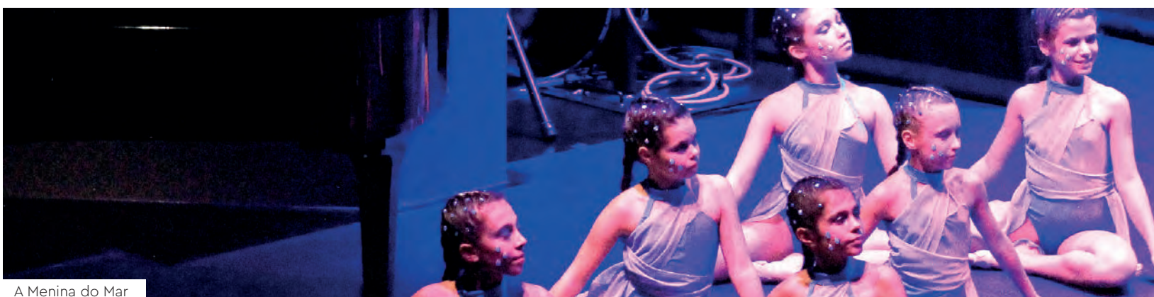
A Menina do Mar